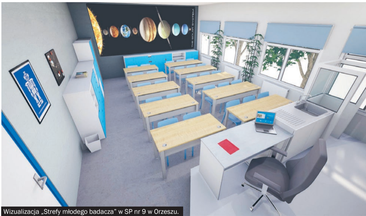
Wizualizacja „Strefy młodego badacza” w SP nr 9 w Orzeszu.

zarządzających tymi placówkami edukacyjnymi, bowiem drugi, powiązany z pierwszym konkurs jest adresowany właśnie do nich. A mowa tu o konkursie: