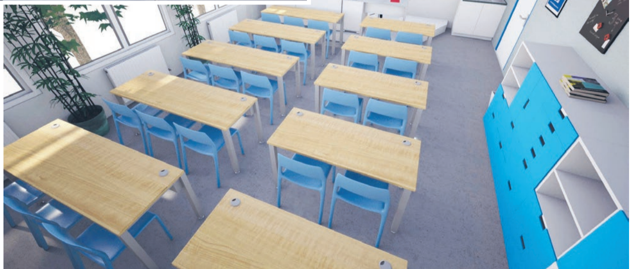
PRACOWNIA „CZAS NA LAS” Szkoła Podstawowa nr 6 im. Jana Pawła II z Oddziałami Integracyjnymi, ul. Wyrska 4, 43-170 Łaziska Górne

Natomiast drugi należy do Szkoły Podstawowej Nr 9 im. Wł. Broniewskiego w Orzeszu i jest zatytułowany „Strefa młodego badacza”. Ten również otrzyma nagrodę w wysokości 7,5 tys. zł. Już same nazwy projektów budzą zainteresowanie, bo nie wiadomo czego możemy spodziewać się po wejściu do takiej ekopracowni. Teraz ruch należy do samorządów