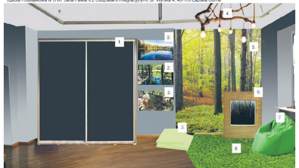
WIZUALIZACJA - tylna ściana pomieszczenia