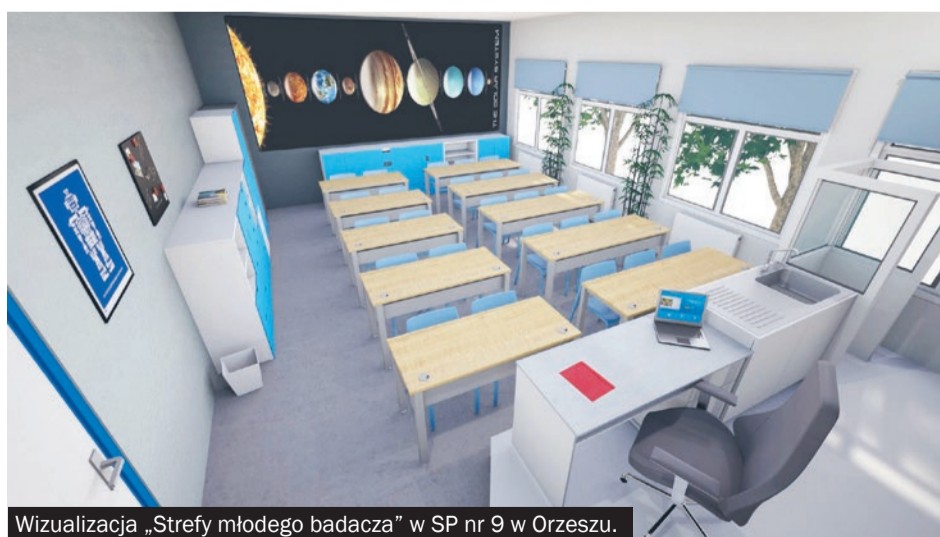
Wizualizacja „Strefy młodego badacza” w SP nr 9 w Orzeszu.

Przedmiotem konkursu było utworzenie projektu szkolnej pracowni na potrzeby nauk przyrodniczych, biologicznych, ekologicznych, geograficznych, geologicznych czy chemiczno-fizycznych. Nadesłane wnioski oceniono biorąc pod uwagę: pomysł na zagospodarowanie pracowni (wykorzystanie przestrzeni, funkcjonalność, estetykę kreatywność, innowacyjność rozwiązań), róż-